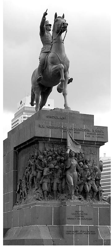
Resim 23: İzmir Atlı Atatürk Anıtı, Pietro Canonica (1869-1962), 1932, bronz-mermer, İzmir.

Amıtın kaidesinde neredeyse üç cepheyi kaplayacak biçimde tasarlanmış bir yüksek kabartma kompozisyon yer alır (Resim 24). Kaidenin ön yüzüne, “Ordular, ilk hedefiniz Akdeniz’dir, ileri! Başkumandan Gazi Mustafa Kemal Eylül 1922.” ve “Büyük kurtarıcıya İzmir’in minnet ve şükranı. Kurtuluş: 9 Eylül” ifadesi bronz harflerle yazılmıştır. Kaidenin üstünde duran heykelde Atatürk, mareşal üniformasıyla atının üstündedir, gövdesi ve başı sola dönüktür, sol eliyle atın dizginlerini tutarken, sağ eliyle ileriye gösterir. Sağ ayağı ileri adım atmak üzereyken betimlenmiş olan at tam karşıya bakar. Kaidenin ön cephesinde, yüksek kabartma tekniğiyle çalışılmış, sağ ayağı önde, Türk bayrağı taşıyan, şalvarlı ve beli hançerli bir kadın figürü, hemen arkasında ise askerler ve halk yer alır. Kabartmanın sol cephesinde, Türk ordusunu sevinçle karşılayan İzmir halkı betimlenmiştir. Askeri kucaklamak üzere kollarını açmış başı örtülü bir kadın, savaş dönüşü babalarına kavuşan çocuklar ve oğluna kavuşan bir yaşlı adam figürü, İzmir halkını temsil eder. Kabartmanın sağ cephesinde, Kemalpaşa yolundaki Belkahve mevkiinden ordu İzmir’e yürürken tarihî bir çınar ağacının altındaki bir çeşmeden başkumandanın su içtiği an sahnelenmiştir. Rölyefe ayrıca, cephaneye dolu bir kağıt ve İzmir Körfezi de işlenmiştir. Kaide mekâna hâkim olacak boyutta yüksektir çünkü amıtın yer-