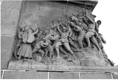
Resim 24: İzmir Atlı Atatürk Anıtı rölyefleri.

leştirildiği meydan deniz kenarındadır ve devasalık, anıtın mekânda kendisini var etmesi açısından gereklidir. Ritim açısından da zengin bir anıt olduğu söylenebilir.