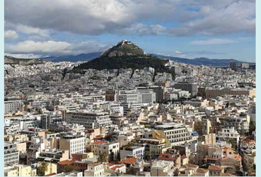
Akropolis'ten Likavittos Tepesi.

Düşünme serüveni Helenistik Dönem'de Stoa Okulu ve Şüphecilerle yoluna devam eder. Bilge insan tipinin filozofa dönüşmesi sürecinde Milet'ten, Güney İtalya'dan (Elea, Kroton) sonra Atina yeni entelektüel merkez olur.