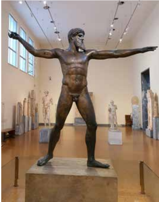
Zeus ya da Poseidon, Atina Ulusal Arkeoloji Müzesi.

Atina'nın bir diğer efsanevi kralı, Kekrops'un torunu olduğu rivayet edilen 4 Theseus'tur.