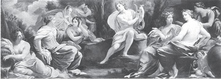
SIMON VOUET, Parnassos veya Apollon ve Müzler, Budapeşte Güzel Sanatlar Müzesi, 1640.

Müze müzlerin mekânı. Dokuz müzden her biri ayrı bir yaratıcı uğraşı gözetir, ona esin kaynağı olur. Örneğin, Melpomene zaten müz sözcüğünden türeyen müziğin, Erato lirik şiirin, Kalliope epik şiirin, Kleio tarihin müzleridir. Homeros destanlarına, Heredotos tarihine müzleri anarak başlar. Müzlere Zeus ile hafıza tanrıçası Mnemosyne can verir.