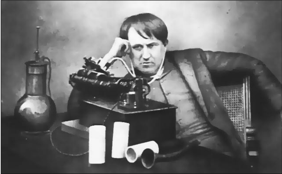
Edison: Yıl 1888. Edison fonografı ile birlikte. Old Gramophones kitabının yazarı Ben Bergonzi'ye göre bu fotoğraf, sabah 05:00 civarı, uykusuz geçirilmiş tam 72 saatlik bir çalışmanın sonunda çekilmiş.