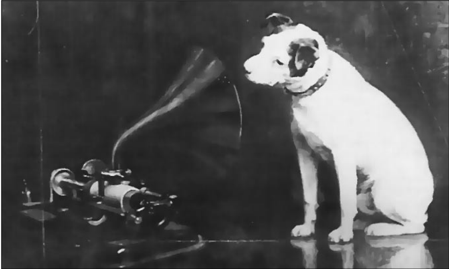
Firma: Fonograf ve gramofonun keşfi ile birlikte, bunları dünyanın her yanına yayacak firmalar da hızla kurulmaya başlandı. His Master's Voice (Sahibinin Sesi) da bunlardan biriydi. Francis Barraud'un çektiği bu fotoğraf, firmanın yıllar yılı değişmeyecek alametifarikasının ilk halidir.

Kanto ve tango furyasını biz taş plaklar ile geçirmekteyken, dışardaki firmalar, bu kadarı ile yetinmiyor, farklı metod ve formatların peşinde koşuyordu. Hiç kullanışlı bir kayıt ortamı sunmayan 10 inç'lik taş plakların yerine daha başka bir şey koymak isteyen firmaların en hızlısı, RCA Victor oldu. Bu firma, diğer firmalara göre çok erken sayılabilecek bir tarihte, 1931 yılında, 50'lerin hemen başından itibaren her yanı saracak 33 devirli LP'lerin (LongPlay) ilk örneklerini verdi piyasaya. 1935 yılında, kayıt yapabilen bir teyp modeli de, Alman AEG firması tarafından Berlin'de halka sunuldu. Savaş yıllarının karışıklığı içinde, bu yeni buluşun patent hakları Amerika'ya geçti ve ilk