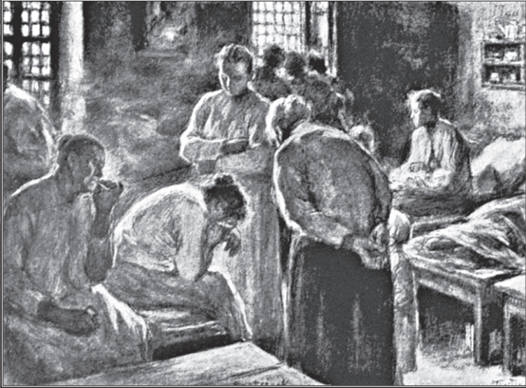
Leonid Pasternak'ın romanın İngilizce baskısı için yaptığı çizimler.