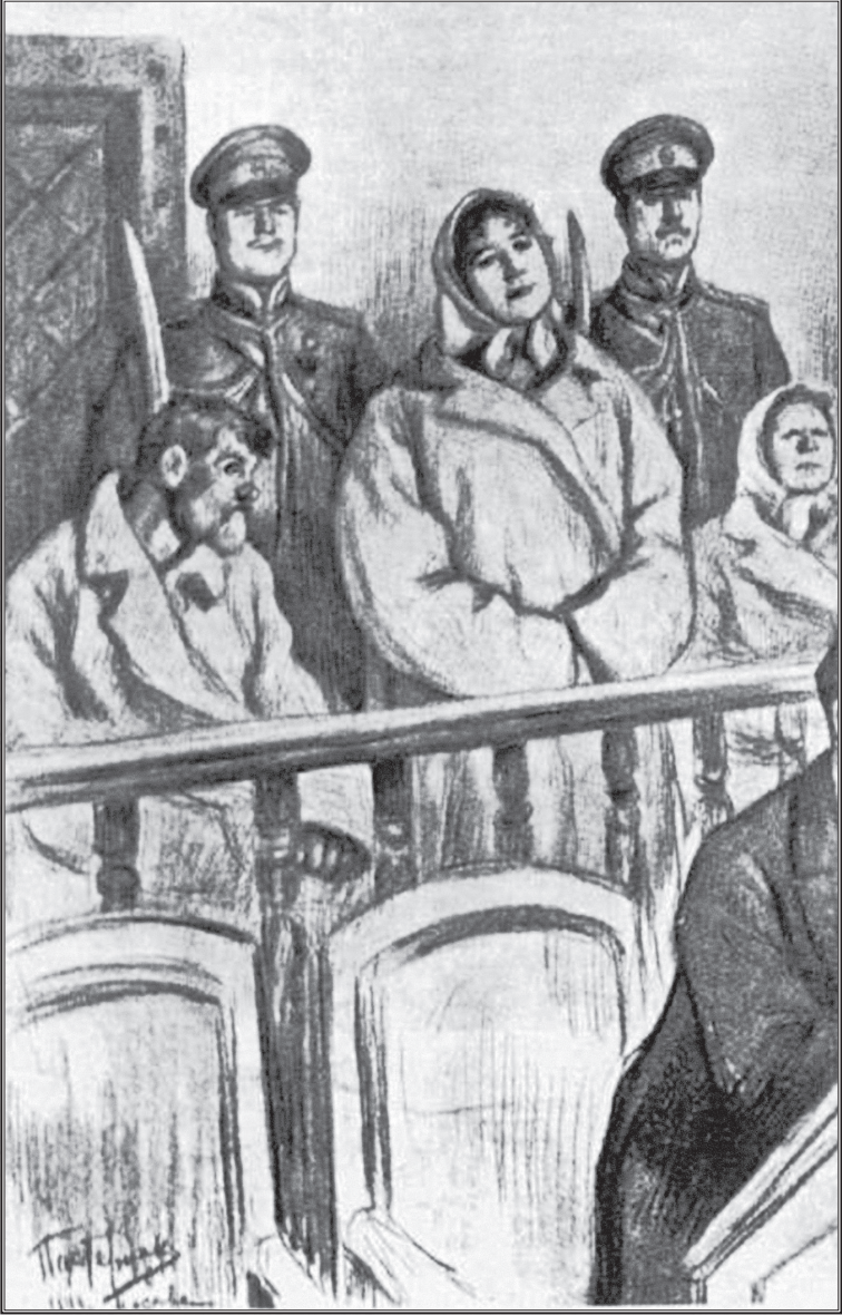
Leonid Pasternak'ın Diriliş için özel olarak yaptığı karakalem çizim.