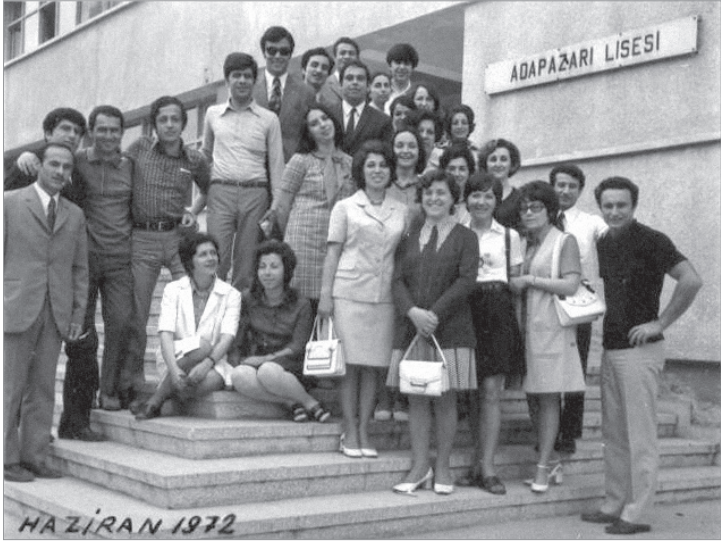
Haziran 1972: İdari tahkikat öncesi, öğretmenlerle.