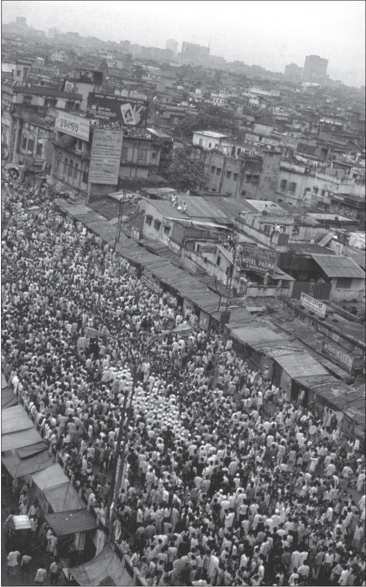
Muharrem Ayı Yas Töenleri, Kalküta.